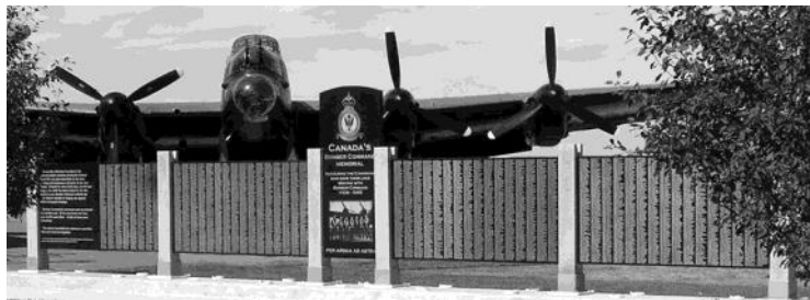
Les noms de plus de dix mille Canadiens sont gravés sur le Mur du Souvenir du Bomber Command Canada.

Des Canadiens servaient déjà dans la RAF au début du conflit, l'engagement de notre pays s'accrut avec la progression de la guerre. En janvier 1943, le groupe n°6 du Bomber Command fut entièrement constitué de Canadiens, officiers et personnels ; à la fin de la guerre, il comptait quatorze escadrons. Plus de dix mille Canadiens périrent au service du Bomber Command, un sacrifice qui ne doit jamais être oublié.